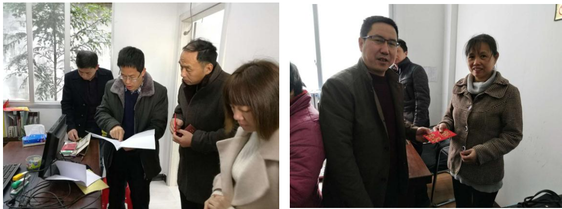
图：到计生困难户家慰问