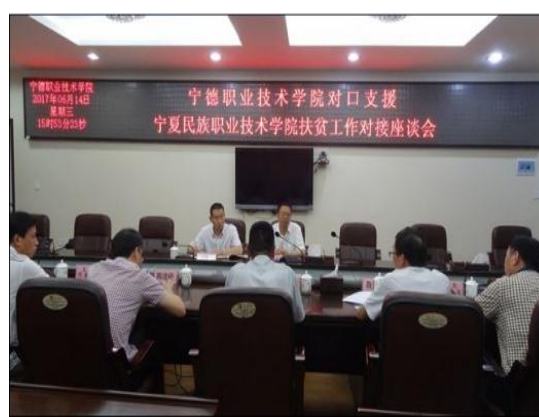
闽宁结对高职院校合作协议签约仪式和对接