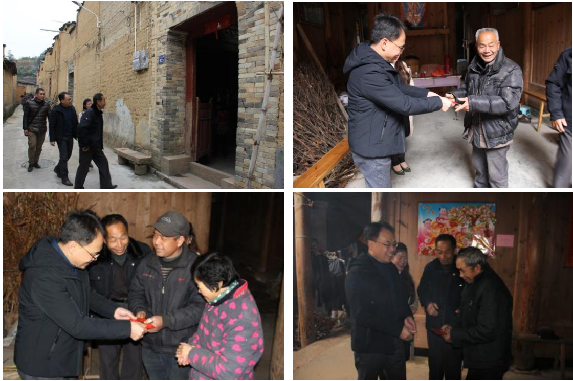
党委工作部部长到贫困县屏南县双溪镇下七房村开展“一助一”爱心助残帮扶活动