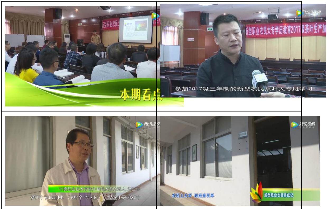
宁德电视台《山海经》报道我校新型职业农民大专学历提升工程 及新型职业农民培育工作