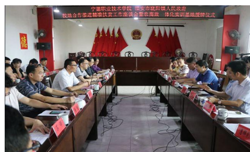
我校与福安市晓阳镇人民政府校地合作推进精准扶贫工作 座谈会暨农商旅一体化实训基地授牌仪式