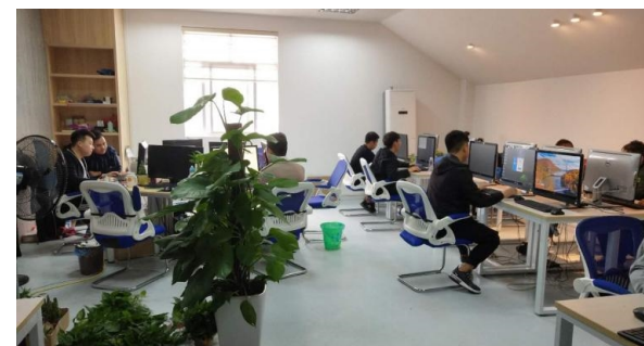
福建省电子商务技能比赛三等奖