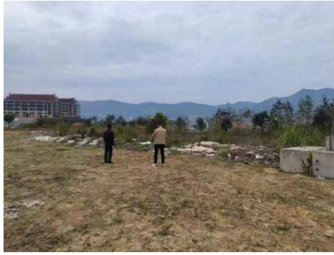
3.五福广场周边建筑垃圾、生活垃圾未清理，杂草未拔除