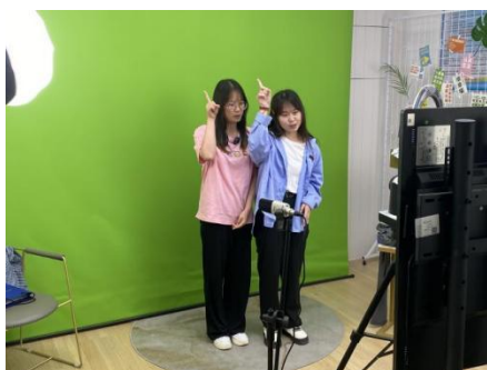
学生参加直播实训

紧密对接区域经济数字化转型，聚焦电商人才缺口，培养适应智能商业时代发展的实战型人才。学生将系统掌握电商直播运营、数据化营销、新媒体矩阵构建等技能，具备数据决策、全域营销、用户管理等核心能力，可胜任主播、网店运营、内容创作等岗位。依托真实项目实战，强化数字工匠精神与团队协作，提升商业洞察与技术应用能力，培养兼具专业素养与创新思维的电商高素质技术技能人才。学生毕业后可选择在互联网和相关服务业、批发业、零售业，从事运营主管、全渠道营销主管、O2O 销售主管、视觉营销设计师、互联网产品开发主管等岗位的工作。