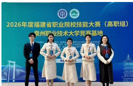
福建省职业院校技能大赛商贸赛道银奖