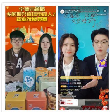
学生参加直播职业技能竞赛