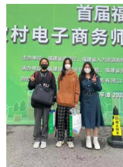
学生获得福建省农村电子商务师比赛三等奖